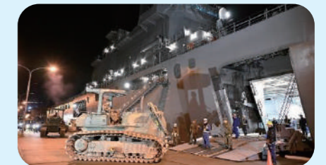
艦艇による物資輸送