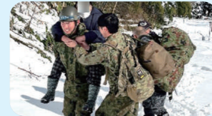
孤立地域からの避難支援