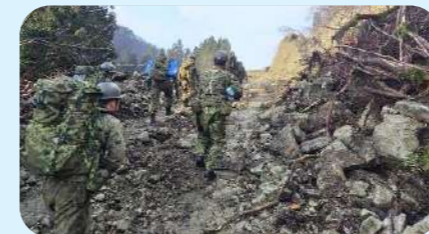
孤立地域への物資輸送