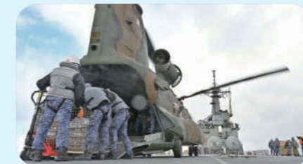
航空機による物資輸送