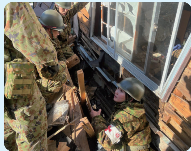
能登半島地震の災害派遣で活動中