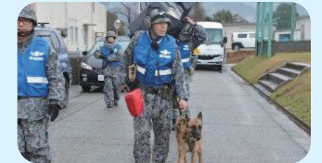
警備犬による人員捜索