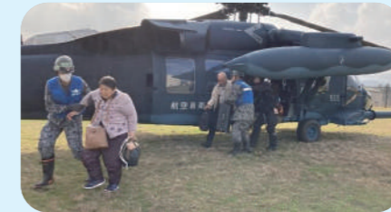
航空機による避難支援